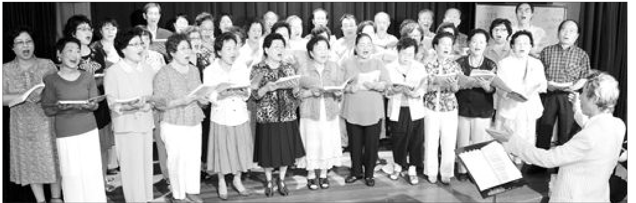
지난 26일 오전 '참고운 소리단' 소속 노인들이 광주시 북구 향토문화회관 2층에서 입을 모아 노래 연습을 하고 있다.