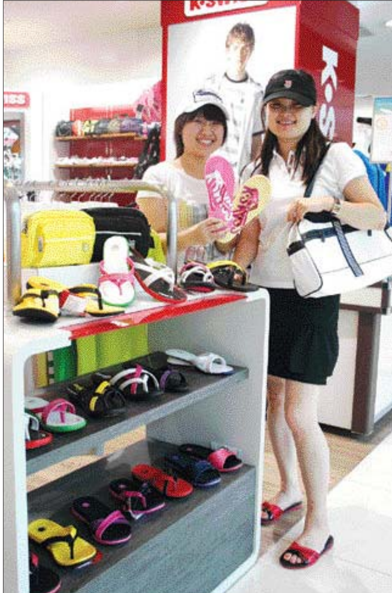
“신발이 편해야 휴가가 편해요” 광주신세계 이마트 지하 1층 패션스트리트 K-swiss 매장에서 비캉스철을 맞아 대형색채의 슬리퍼를 선보여 휴가를 앞둔 고객들의 눈길을 끌고있다.

온 첨부파일이 의심스러우면 절대 열어보지 말 것 ▲특정 사이트에 접속할 때 생성되는 정보를 담은 임시 파일(쿠키)은 정보가 쉽게 빠져나갈 수 있어 브라우저(browser)에서 허용 말아야 하고 ▲p2p 프로그램에서 파일을 내려받을 때에는 반드시 백신으로 검사한 후 사용하며 ▲바이러스 백신은 항상 최신 버전의 엔진으로 업데이트하고 수시로 검사하며 개인 방화벽 제품을 사용해야 한다. 광주정보통합전산센터 보안관리과 관계자는 "자신도 모르게 해킹당할 수 있다는 사실을 염두에 두고 수시로 PC를 점검하는 게 최선"이라며 "바이러스는 진화하기 때문에 관련 백신프로그램을 그때마다 다운받아 보안상태를 최상으로 유지해야 한다"고 조언했다. /광명기자 kps@kwangju.co.kr