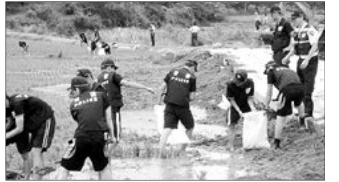
전남지방경찰청(청장 유근섭)은 9일 나주 산포면 등정리와 신안군 자은면 등에서 경찰 100여명 등 300여명을 동원해 수해복구 봉사활동을 펼쳤다.