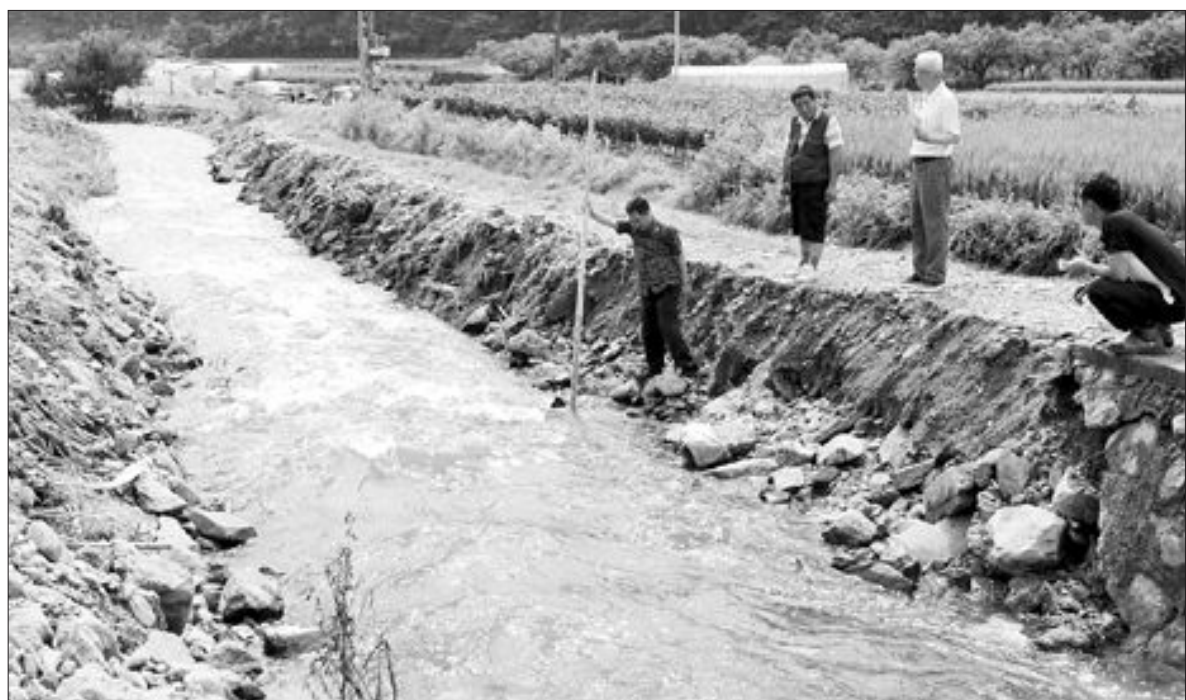
나주 남평 하천 폭우 피해 조사. 정부 중앙합동조사단이 15일 폭우 피해 지역인 나주시 남평을 등촌리에서 유실된 하천의 피해현황을 조사하고 있다.

는 성질이 있는 점을 이용, 박테리아에게 초소형 로봇을 움직이도록 이른바 추진체 역할을 부여하는 것이다. 약물을 담은 초소형 캡슐 주위를 박테리아가 감싸 로봇 역할을 한 뒤 특정 암세포 부위에 도달하면 약물을 방출하고 스스로 분해된다. 마치 미사일 공격처럼 특정 암세포 부위에만 약물을 집중적으로 투여하기 때문에 암세포 이외에 정상 세포까지 손상하는 일반 항암제 투여 방식의 부작용을 크게 줄일 수 있다. 이 로봇은 크기가 0.001~0.01mm로 혈관을 뚫고 지나갈 수 있을 정도로 작아 내시경이 닿을 수 없는 환부까지도 치료할 수 있다. 박테리아 자체의 독성은 유전자 조작을 이용해 제거하고 형광 유전자를 집어넣어 외부에서도 움직임을 관찰할 수 있다. /채희중기자 chae@kwangju.co.kr