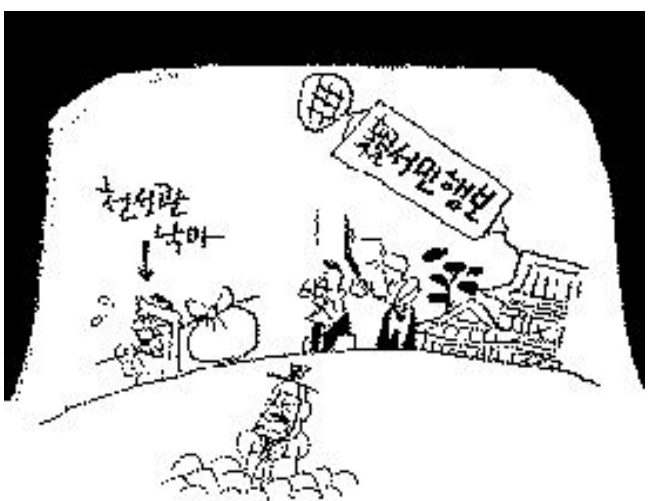
人物 찾으면 '강부자' 뿐이고 ...