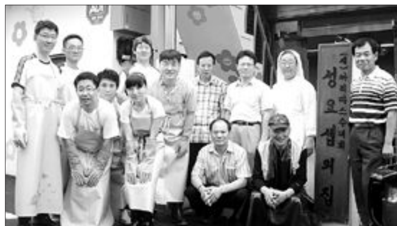
광주시 남구 진월동성당 레지오 단원과 교보증권 남광주지점 직원 20여명이 최근 남구 방림동 까리티스 수녀원 성요셉의 집을 방문해 봉사활동을 했다.