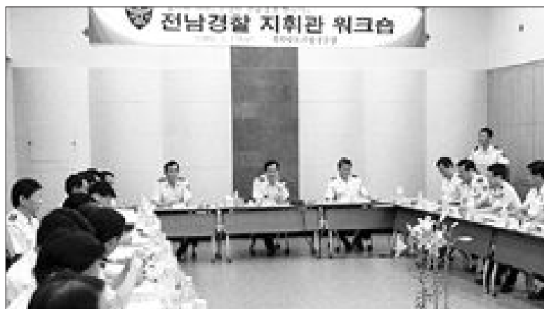
전남지방경찰청(청장 유근섭)은 최근 동신대학교에서 전남경찰청 과장·담당관 및 21개 경찰서장 등 간부 31명이 참석한 가운데 '건강한 경찰만들기'를 위한 지휘부 워크숍을 개최했다.