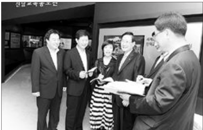
김장환 전남도교육감(왼쪽에서 네번째)이 21일 전남도교육청 신청사 본관 1층에 마련된 ‘전남도교육홍보관’을 방문, 관계 공무원들로부터 운영에 관한 업무 보고를 받고 있다.