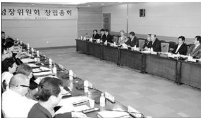
“광주시 녹색성장위원회”가 지난 20일 광주시청 3층 소회의실에서 창립총회를 가졌다. 안희숙 위원장(전 YWCA 사무총장)을 비롯해 민간위원 22명 등 30명으로 구성된 녹색성장위원회는 ‘저탄소 녹색성장’ 정책과 추진전략을 수립하게 된다.