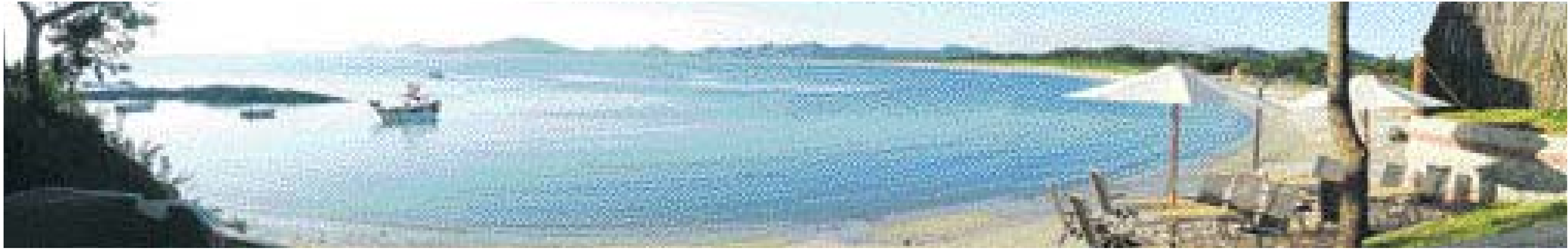
산과 바다의 아름다운 절경과 다양한 축제가 휴가철을 맞은 피서객들의 발길을 사로잡고 있다. 사진은 드넓은 백사장이 돋보이는 신안군 증도면 우전해수욕장.