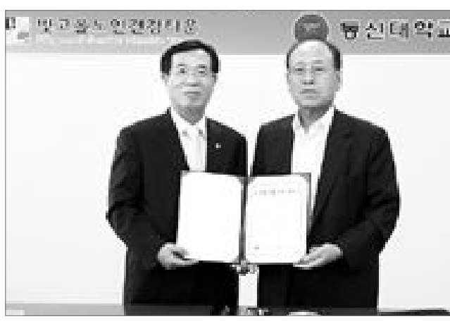
동신대학교(총장 정기연)와 빛고을노인건강타운(원장 니무석)은 지난 29일 빛고을노인복지재단 회의실에서 노인복지 발전과 실천을 위한 교류 협약을 체결했다.