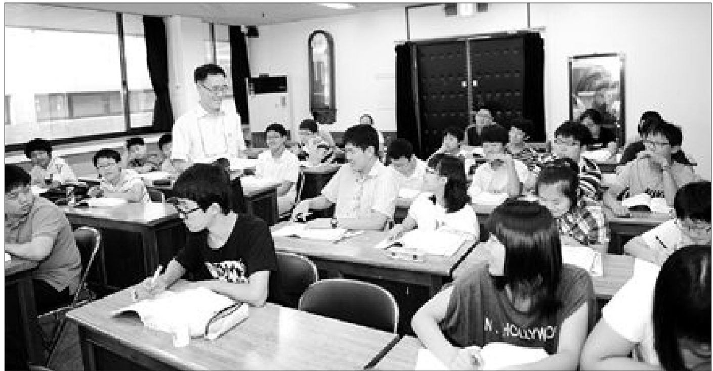
30일 광주중앙도서관 내에 마련된 영어교실에서 동부 교육청 관내 중학생 70명이 TEPS 수업을 받고 있다.