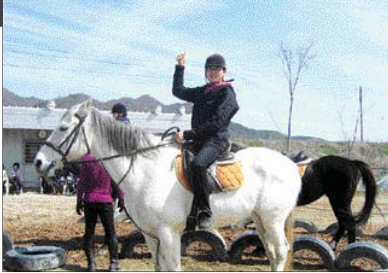
'THE행복한 주말나기 명품프로그램'에 참여한 장애청소년들이 '승마' 체험을 하며 즐거워하고 있다.

말을 직접 타 보는 행위는 장애청소년들에게 많은 변화를 주고 있다. 장애청소년들에게 승마는 단순히 말을 타는 것에서 그치는 것이 아니라 말의 움직임을 스스로 느끼며 신체의 리듬을 찾아가고 말과 교감을 나누며 긍정적 감정을 형성하여 심리적인 안정감과 자신감을 갖도록 한다.