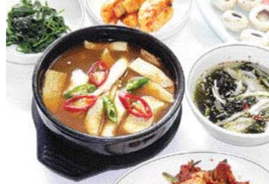
<돼지기 등 푸짐한 밀반찬>