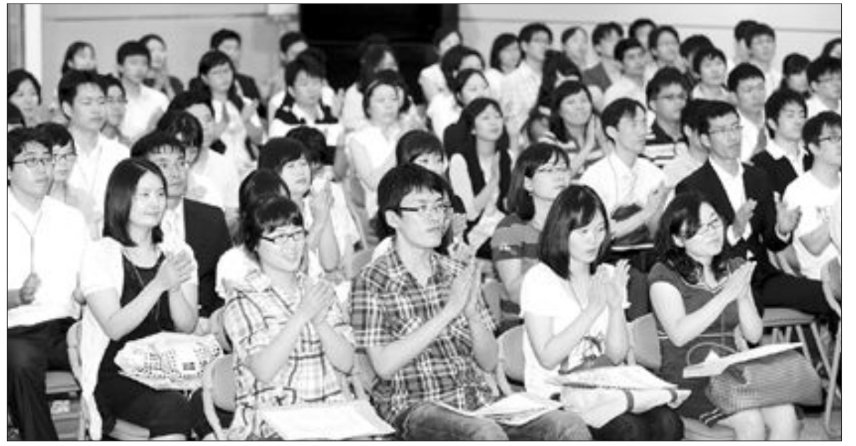
“공직자는 청렴해야 합니다”

또 겸·인정 교과서 확대, 교과서 외형 개편, 재생용지를 활용한 교과서 제작, 교과서 물려주기·대여제 실시 등 교과서 선진화를 위한 후속 조치를 추진해 나갈 계획이다. /연합뉴스