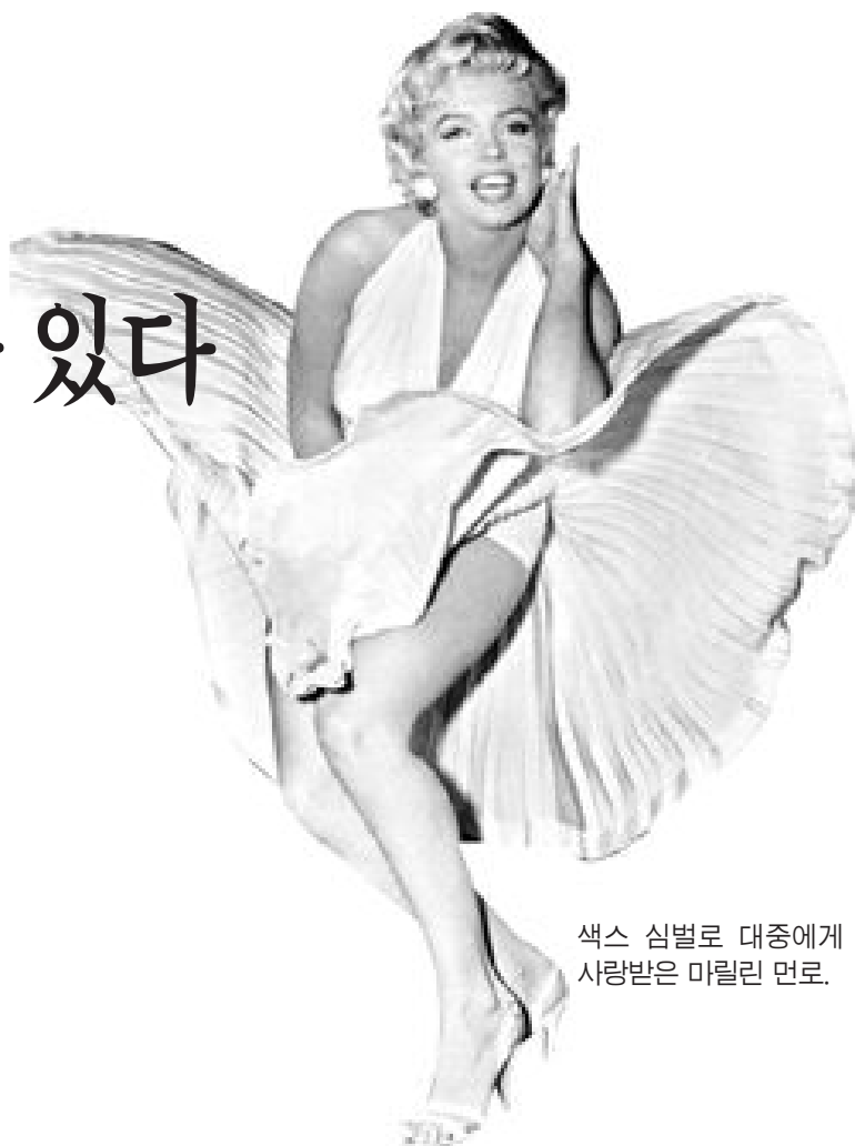
색스 심벌로 대중에게 사랑받은 마릴린 먼로.

날렸다. 그러나 그는 자신에게도 혹독했다. 그는 자신부터 철학을 포기해야겠다고 생각해 케임브리지 대학을 한 학년만 다니고 오두막에서 기초논리학에만 전념한다. 제1차 세계대전 중에는 ‘관측 장교’로 참전하기도 한다. 말년까지 그는 그 누구와도 친하지 않았지만, 그의 학생들 사이에서는 당대에 이미 영웅이었다. 그리고 그의 죽음과 함께 기인에서 만인의 영웅으로 변모했다.