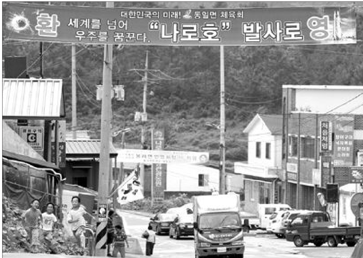
'발사 성공' 현수막

한국 첫 우주발사체 나로호(KSLV-I) 발사를 이틀 앞둔 17일 고흥군 봉래면 나로우주센터 주변 곳곳에 '발사 성공'을 기원하는 현수막이 붙어있다.