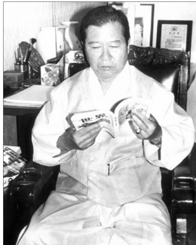
'독서광' DJ 1987년 통일민주당 상임고문이었던 김대중 전대통령이 한복을 입은 채 종교동지택 서재에서 집지를 읽고 있다.