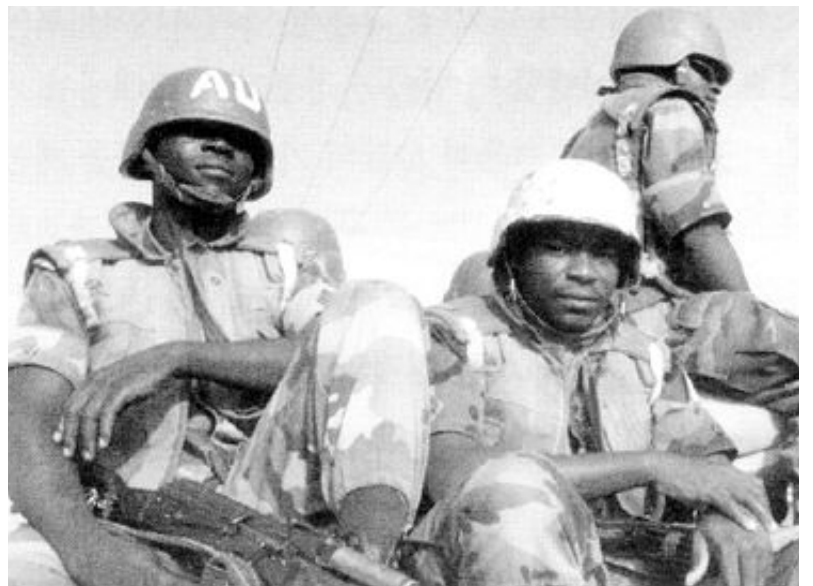
남아프리카공화국의 민간군사기업 '이그제큐티브 아웃컴즈'의 흑인 대원들. 이 회사는 현대적 응병기업의 모델로 많은 민간군사기업에 영향을 미쳤다.

저자는 '저비용 고효율'을 내세워 미국 정부가 민간 기업에 보안 문제를 일임함으로써 일게되는 이득은 단순히 경제적 비용 절감에 그치는 게 아니라 정치적 부담을 해소하는 데 유용하다고 강조한다. 군사력 남용 등에 대한 비난을 '민간 군사기업'에 떠넘길 수 있기 때문이다. 문제는 세계 각지에서 활동하는 군