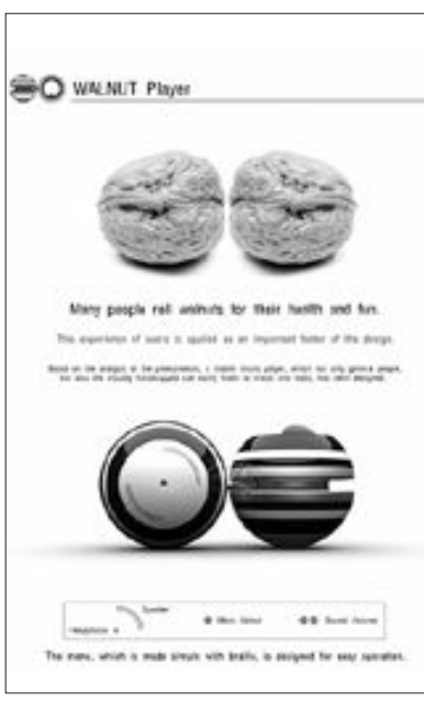
강유광(4년) 학생의 독일 ‘레드닷 디자인 어워드’ 입상작인 ‘walnut player(노인용 자가충전 놀이기구)’. 사람들이 호두를 굴리는 습관을 뮤직플레이어에 적용시킨 디자인.