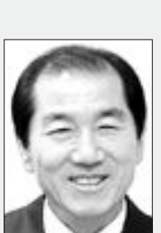
광주도시철도공사 사장은 “노인들과의 자택을 방문, 청소, 말벗 봉사를 펼치기로 했다. 도시철도공사 임직원들은 지난 2004년부터 6년째 매월 일정액을 모아 불우이웃 시설에 내고 있고, 저소득층의 노후화된 주택을 무상으로 개보수해주는 ‘생활개선 봉사단’ 활동을 2년째 펼치고 있다.”

28일에는 경영본부 직원들이 서구 풍암동 동명전문요양원을 찾아 환경미화과 식사 배식 등을