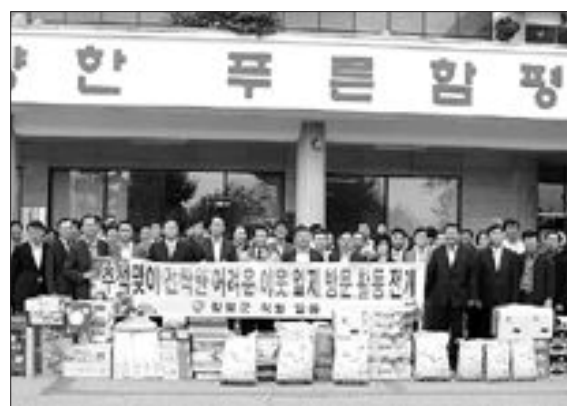
함평군 공무원 500여명은 최근 독거노인과 다문화 가정 등 400여 가구를 선정, 쌀·과일 등 2천500만원 상당의 위문품을 전달했다.