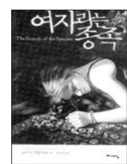
'여자를 위한' 책 표지

▲낙산재의 마지막 여인=일본사람이 쓴 조선의 마지막 황태자비 이방자 여사의 일생을 담은 평전이다. 이방자가 왜 조선의 왕자비로 선택됐는지, 왕자비가 된 뒤의 심정은 어땠는지, 왜 전후 대한민국에 남아서 복지사업에 정열을 쏟았는지 분석했다. 또 이방자의 결혼이 이씨 왕가와 한국 사회에 어떤 영향을 끼쳤는가에 대해서도 살펴본다. <동아일보사·1만3천원>