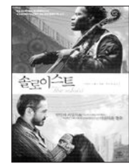
'솔리스트' 책 표지

▲내 인생의 오디션=국가원수를 비롯해 정치지도자, 유명 배우, 살인자 등 숏한 뉴스 메이커들과 인터뷰를 성사시킨 전설적인 뉴스앵커 바버라 월터스의 회고록. 전 세계 영향력 1위 앵커 우먼이 들려주는 사람과 성공 이야기로 남성들이 텔레비전을 지배하던 시절에 시작해 정상의 자리에 오르기까지 여성으로서 겪어왔던 좌절과 실패, 우여곡절을 상세히 담았다. <프리뷰·3만원>