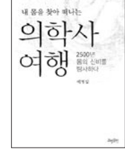
'의학사 여행' 책 표지

▲한창춘의 향연=바다와 섬을 배경으로 한 작품을 발표해온 소설가 한창춘의 첫 번째 산문집. 고향 거문도에서의 유년기와 여수로 나온 뒤 성장통을 겪으며 커가는 이야기를 비롯해 살아오면서 만난 인간들에 대한 이야기가 흥미롭게 펼쳐진다. "산골 아이 지게 작대기 너머 비행기 울라다보듯 세상이란 돌담과 몇 이랑의 밭과 그것보다 조금 적은 숫자의 어선, 그리고 끝을 알 수 없는 바다로만 되어 있다고 생각"하며 자랐다는 작가의 눈길이 선하다. <중앙books·1만1천원>