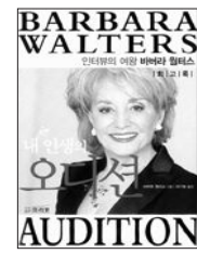
BARBARA WALTERS의 'AUDITION' 책 표지

▲내 인생의 오디션=국가원수를 비롯해 정치지도자, 유명 배우, 살인자 등 숏한 뉴스 메이커들과 인터뷰를 성사시킨 전설적인 뉴스앵커 바버라 월터스의 회고록. 전 세계 영향력 1위 앵커 우먼이 들려주는 사람과 성공 이야기로 남성들이 텔레비전을 지배하던 시절에 시작해 정상의 자리에 오르기까지 여성으로서 겪어왔던 좌절과 실패, 우여곡절을 상세히 담았다. <프리뷰·3만원>