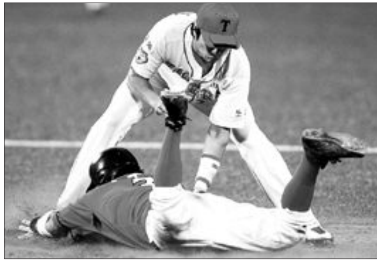
인기 작가 오쿠다 히데오의 '야구장 습격사건'은 일본 야구에 숨어 있는 재미를 소개하는 책이다. 사진은 프로야구 KIA와 SK의 경기모습.

무게 145g 내외의 작은 공이 투수의 손을 떠나 타자에게 도착하는데 걸리는 시간은 보통 1.35초. 타자가 이 공의 위치와 속도를 판단한 뒤 106cm 내외의 방망이로 때려내는데 0.47초. 왜 사람들은 2초도 안 되는 이 짧은 시간에 승부가 갈리는 야구에 열광하는 것일까?