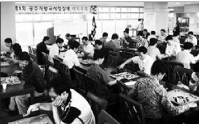
광주지방국세청은 최근 정부광주지방합동청사 구내식당에서 사내 비독동호회 회원 80여명이 참석한 가운데 제1회 광주지방국세청장배 비독대회를 열고 친목을 다졌다.