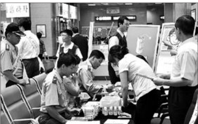
한국건강관리협회 광주·전남지부는 지난 1일 오후 광주역에서 귀성객을 대상으로 신종플루 예방수칙 안내문 배부와 발열체크, 금연상담, 혈압 및 혈당검사를 실시했다.