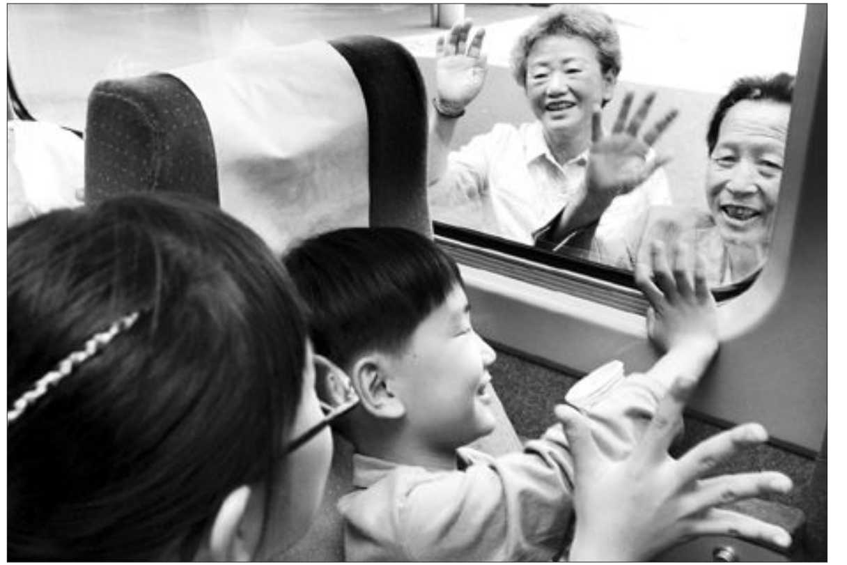
설날에 또 보자

짧은 추석연휴의 마지막 날인 4일 오후 광주역에서 서울로 가는 KTX에 오를 아이들이 할아버지 할머니와 아쉬운 이별을 하고 있다.