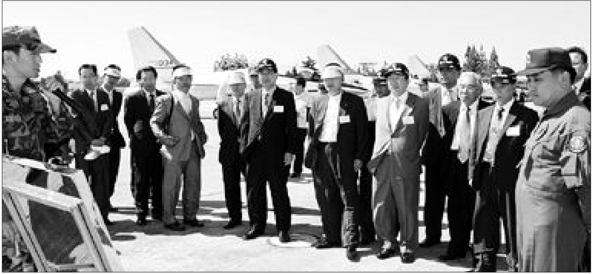
공군 1전투비행단 창설 60돌

가 있는 지를 타진했다"고 말했다. 또 군은 지난 6일 공식 입장표명에서 "소장자와 직접 접촉, 통화한 사실이 전혀 없었으며, 오직 최관장을 통해서만 매입가격에 대한 협상을 벌였다"고 밝혔다. 한편, 황주홍 강진군수는 이날 군청회의실에서 기자회견을 열고 '청자상감연국도란문과형주자'(2007년 구입)와 '청자상감도란문정병'(2009년 구입) 두 작품을 공개 재감정하겠다고 밝혔다. 황 군수는 또 "국정감사에서 의혹이 제기된 만큼 시비비비를 가리고자 2007년 매입에 관여한 평가위원 등을 사법기관에 형사고발 할 계획이다"고 말했다. /윤영기기자 penfoot@kwangju.co.kr /강진=남철희기자 chou@