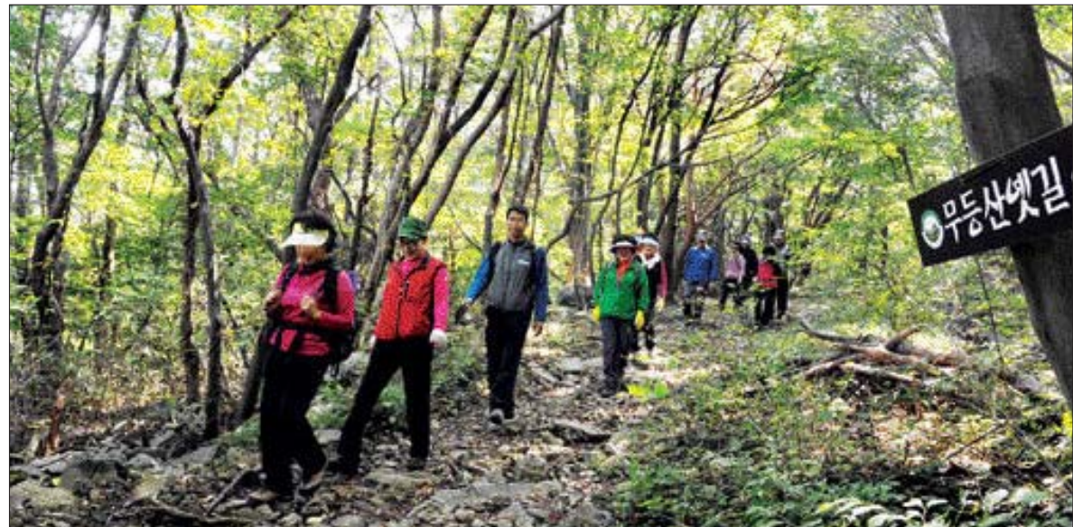
오는 10일 무등산 옛길 2구간(원효사~서석대)의 개방을 앞두고, 무등산관리사무소 소속 직원과 문화관광해설사 등이 구간 내 시설물과 자연생태를 점검하고 있다.

◇제철유적~치마바위=원효사에서 2.3km 떨어진 지점에서 치마바위(너럭바위)와 만난다. 10여 명이 단체로 앉아 휴식을 즐길 수 있는 공간으로, 그 옆으로는 맑은 계곡이 있다. 풀참나무 군락지와 곳곳에 희귀한 노각나무, 사람주나무 등이 우거져 있으며, 쇠딱따구리, 꿩, 개구리, 도롱뇽 등 다양한 생물들을 접하게 된다. 바지가랑이에 스치는 산대나무의 사각거리는 소리가 경쾌하다.