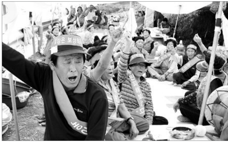
여수시 세포리·석계마을 주민 200여명이 지난 10일 화양면 골프장 공사현장에서 어장피해 대책마련과 보상을 요구하며 천막농성을 하고 있다.