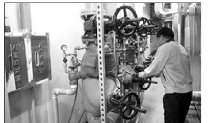
광주시청 청사관리계 직원들이 12일 가을철 화재예방을 위해 시청사를 대상으로 소방안전점검을 실시하고 있다. 시는 이날부터 한 달 동안 화재예방에 대한 민·관의 의식 고취를 위해 공공기관에 대한 소방시설을 집중 점검할 방침이다.