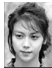
으로 열연을 펼쳤다.

영화 ‘박쥐’의 여주인공 김옥빈(광양 출신)이 스페인에서 열린 제 42회 시체스 국제영화제에서 여우주연상을 수상했다. 영화제 집행위원회는 12일 여우주연상의 주인공으로 한국의 김옥빈과 스페인의 여배우 엘레나 아나야를 선정했다고 밝혔다. 시체스 영화제는 포르투갈의 판타스포르토, 벨기에의 브뤼셀 영화제와 더불어 세계 3대 판타스틱 영화제로 손꼽히는 국제 영화제다. 이번 영화제에 초대된 한국영화로는 ‘박쥐’ 외에 ‘해운대’