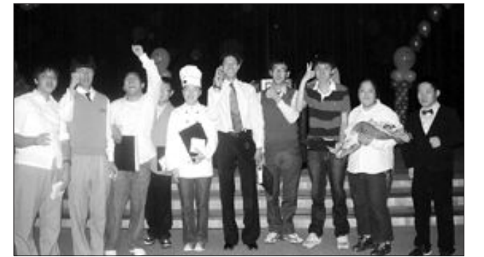
광주 지적장애인 자기권리주장대회에서 권리주장상 등을 받은 영광의 수상자들.

한 변호사는 강연을 마친 후 광주일보와 가진 인터뷰에서 ‘김대중 전 대통령 서거 이후 한국 사회 변화’에 대해 “DJ 서거 이후 그분의 뜻을 유지·계승·실현해나가야 하는데 추모라고 하면서 말 잔치만 앞세우는 무리들이 있다. 한 시대를 풍미한 ‘어른’이었던만큼 한때 화두에 그치는 게 아닌 살아남은 자들이 앞으로 어떻게 계승해나갈지 고민해 봐야 할 시기다”고 조언했다.