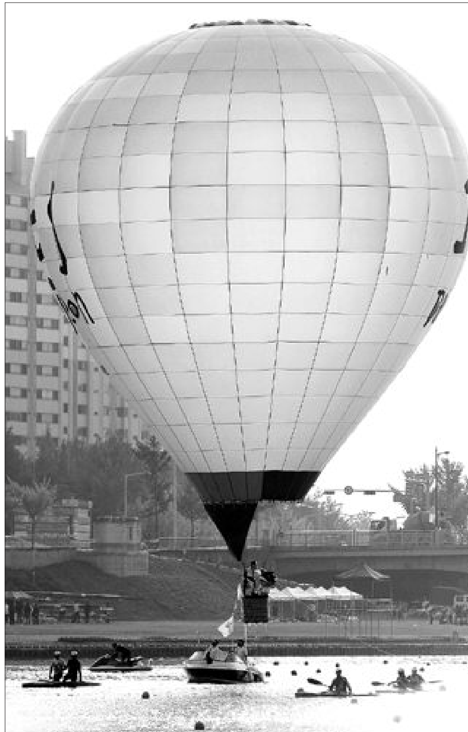
제90회 전국체전 선행 화합식이 열린 14일 선화 봉사자들이 열기구를 타고 보트에 탄 승주자에게 선화를 전달해주고 있다.