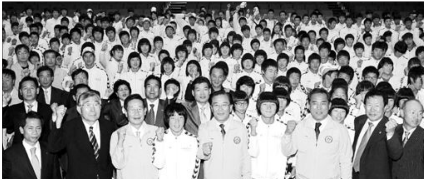
제90회 전국체전에 참가할 전남선수단이 14일 전남도청에서 결단식을 갖고 필승 결의를 다졌다. (전남도제공)

김창준 회장은 "살짜기 쉬운 계절 가을 생활체육과 함께 일주일에 3번 하루 30이상 운동으로 건강도 챙기고 가족과 즐거운 시간도 가져보실 바란다"며 생활체육 참여를 당부했다. /서승원기자 swseo@