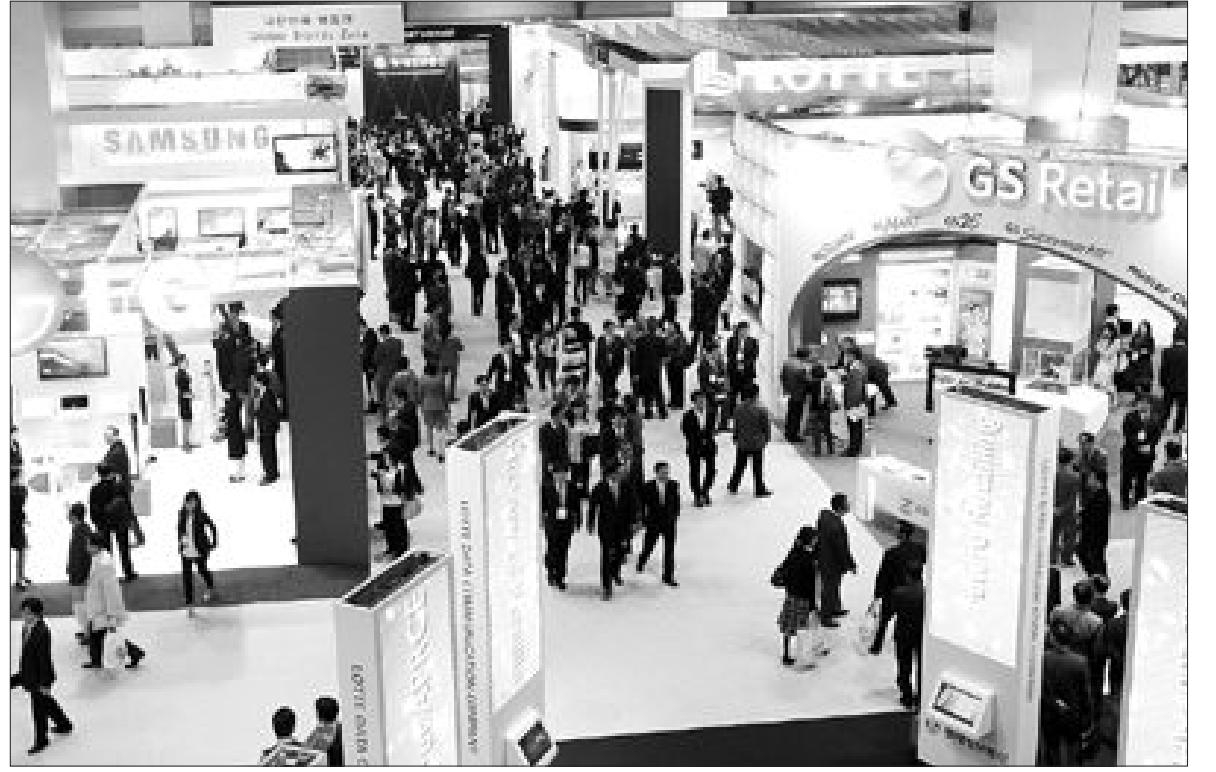
‘유통 올림픽’ 개막 14일 코엑스에서 개막한 제14회 아·태 소매업자대회. 대한상공회의소와 아시아태평양소매업협회연합, 한국소매업협회 등이 이날부터 이틀간 공동 개최하는 아·태 소매업자 대회는 2년마다 역대 유통업계 최고경영자(CEO)들이 모여 유통업의 미래상을 알아보고 최신 정보를 교환하는 행사이다.

36시간 이상 취업자는 5만6천명이 증가하는 등 광주와 비슷한 추이를 보였다. 광주와 전남의 경제활동인구 역시 각각 68만5천명, 93만7천명으로, 지난해 9월보다 3만명, 6천명이 증가했다. 이 같은 고용시장의 개선에 힘입어 지난달 광주와 전남의 실업률은 각각 3.5%, 1.1%로, 지난해 같은 기간에 비해 모두 0.6%씩 감소했다. 청년실업률은 광주가 6.3%, 전남은 5.1%였다. 광주시 관계자는 "예산 조기 집행 등 중앙정부와 지방자치단체의 선제적 대응과 환율 안정, 수출 향상 등 각종 실질지표들이 나아지고 있으며, 이에 따라 고용도 좋아지고 있는 것으로 분석됐다"며 "특히 정규직이 늘어나는 등 고용의 질이 개선되고 있는 것이 무엇보다 좋은 현상"이라고 설명했다. /*원천적기자 chadol@kwangju.co.kr