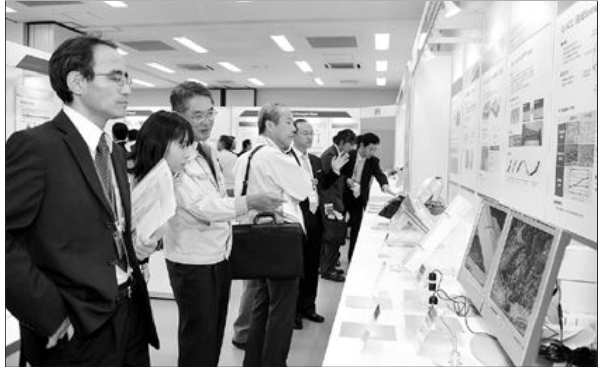
도요타 전시 광양제철 차량관

지난 20일부터 이틀간 일본 도요타 자동차에서 열린 포스코 광양제철소 제품 전시회에서 도요타 임직원들이 자동차 전용 고강도 강판 등을 살펴보고 있다. 이번 전시회는 1천여명이 둘러봤으며, 양사는 장기적인 협력 관계 구축에 대해서도 협의했다. 광양제철은 올 1월부터 도요타에 자동차 강판을 공급하고 있다.