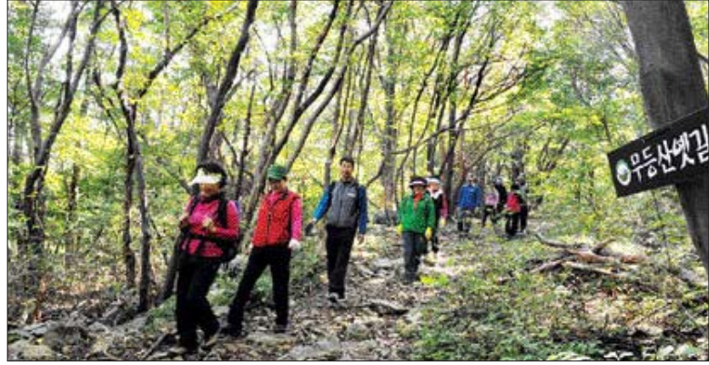
지난 5월 원호사 인근 무등산 옛길에 복원돼 시민들이 도심에서부터 걸어서 옛 선조들의 문화와 정취를 만끽하며 무등산을 오를 수 있게 됐다.

무등 사계(四季)중 가을서정 만산호수에 사색을 품고 원호사에서 서석대의 복원 열림 길은 마음 설레는 길이다. 선조들이 철제 주조물을 만들었던 주검동과 삼발실, 관방유적(關防遺蹟) 등 삶의 흔적을 뒤돌아보며 역사문화를 잠시 생각하게하고 울창한 삼림과 물소리 바람소리 새소리 정적인 숲속 향기 자연생태에 침잠되어 무아지경에 빠져들어 가는