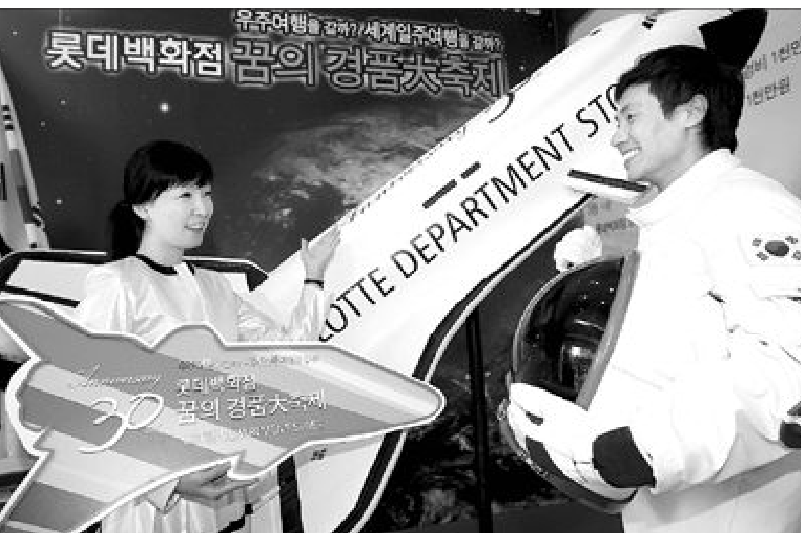
"우주여행 보내드립니다" 롯데백화점이 5일 서울 소공동 본점에서 창립 30주년을 맞아 최고·최대 경품 캠페인을 개최했다. 이번 경품행사는 6~22일 구매와 상관없이 만 20세 이상이면 누구나 응모할 수 있으며 1등 1명에게는 준케도까지 상해 우주와 지구를 동시에 감상하는 우주여행권을 제공한다.

에 판매됐고, 무도 재래시장에서 개당 880원으로, 대형마트보다 19.3% 싼 가격에 거래되고 있다. 미나리 400g에 재래시장은 8천200원, 대형마트에서는 이보다 2배 이상 비싼 1만8천100원, 마늘 1kg도 재래시장에서는 1만380원, 대형마트에서는 1만5천450원에 구입할 수 있다. /유현석기자 chadol@kwangju.co.kr