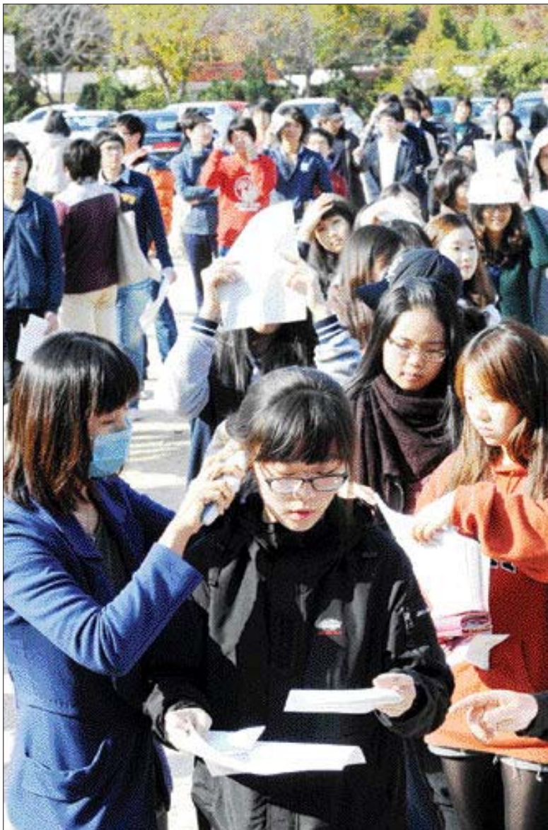
수능 예비소집 발열검사 11일 광주 화정중학교 운동장에서 진행된 2010학년도 대학수학능력시험 예비소집에서 수험생들이 발열검사를 받고 있다.