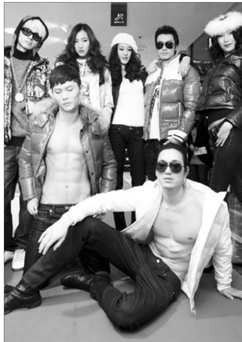
겨울의상 멋지게 11일 서울 소공동 롯데백화점에서 열린 패션쇼에서 모델들이 다양한 겨울 의상을 선보이고 있다. /연합뉴스

를 가지고 있는 농협중앙회에 절대적으로 유리하고, 재무제표 항목도 2년 전 평가에서는 2년치였는데 이번에 3년치로 바뀌 농협에 유리할 수 밖에 없다고 지적했다. 또 다른 위원도 구 금고 선정의 목적이 주민들의 이용 편의성에 있는데도 광주시나 남구 관내의 점포망 수가 훨씬 적은 곳을 염두에 둔 선정 방식은 문제가 있어 행정안전부 금고 선정 지침에 따른 것을 요구했다고 설명했다. 이와 관련 남구청 관계자는 "행안부 자문을 받아 평가항목을 선정할만큼 절차에는 문제가 없다"고 말했다. 한편 남구청 금고는 광주은행이 1995년 남구청 개청 이후 14년동안 맡아왔으며 지난 2007년 공개경쟁 입찰에 이어 이번에 농협과 재 대결하게 됐다. 남구 금고는 연간 2천800억원 규모로 선정 금융기관이 운영하는 자금은 평균 잔액인 650억원 정도다. /장필수·김형호기자 bungy@kwangju.co.kr