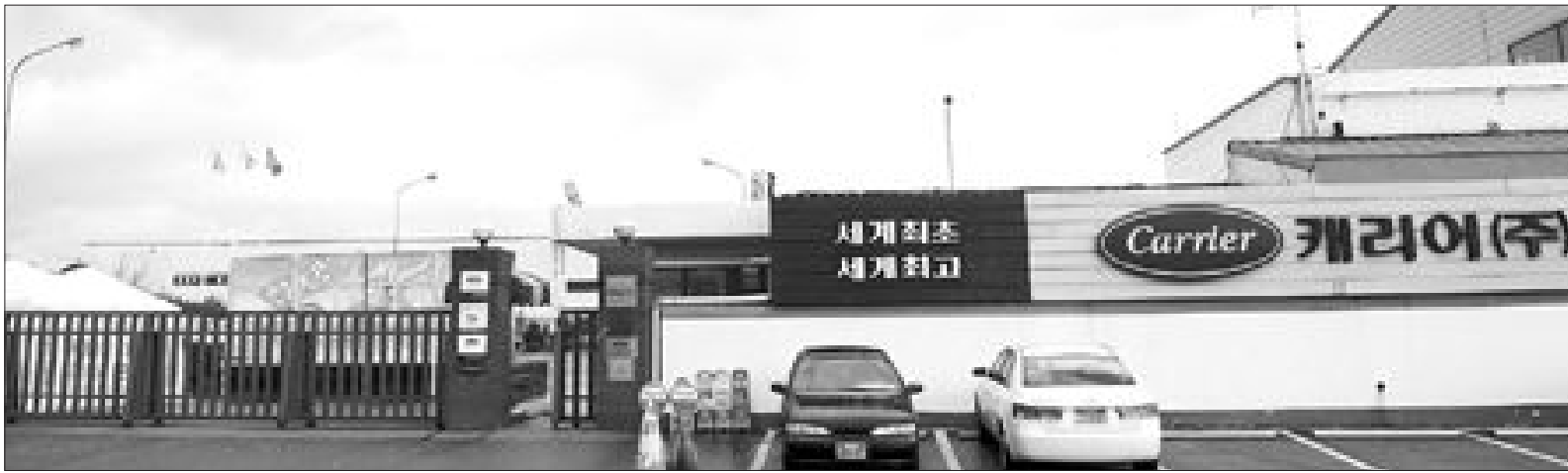
곧게 닫힌 공장 문

지난 주말 근로자들을 무더기 해고한 캐리어(주) 공장 문이 15일 곧게 닫혀있다. 사측은 16일부터 1주일간 휴업에 들어간다고 근로자들에게 통보했다.