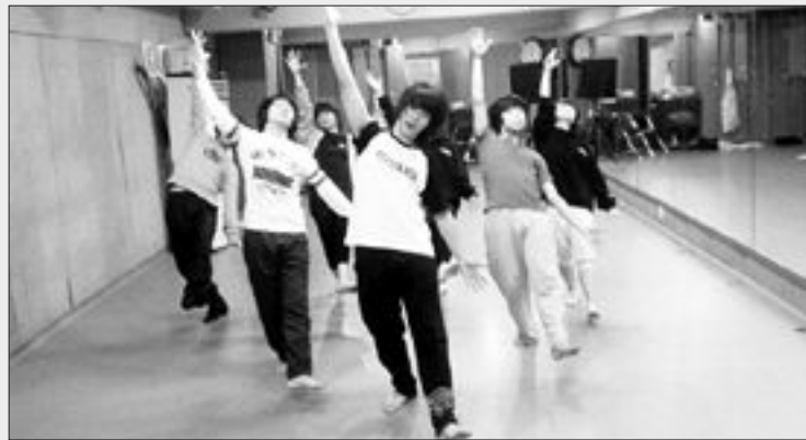
뮤지컬 '화려한 휴가' 연습중인 송원대 학생들

내년 1월 유·스퀘어 문화관에서 쇼케이스 첫 선 광주시·문화도시추진단 48억 투입 대표 콘텐츠로 상설공연·전국 10개 도시 순회·해외 투어도 추진