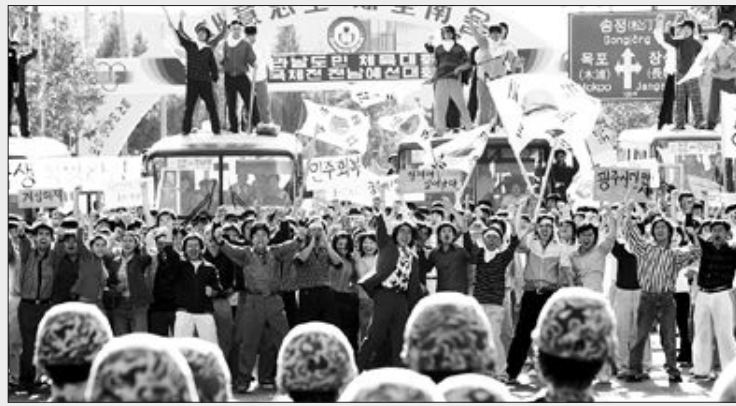
뮤지컬로 제작되는 영화 '화려한 휴가'의 한 장면.