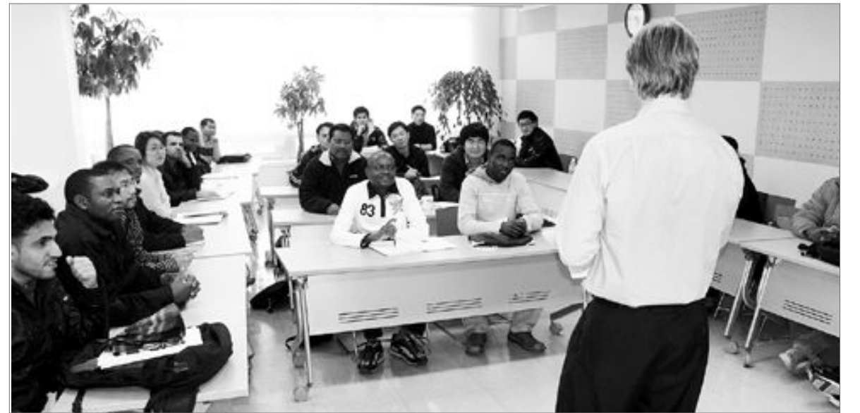
“해운 물류관리 인재를 찾습니다”

해운물류 분야의 매니저급 관리자를 육성하는 네덜란드 국제물류대학 한국캠퍼스(STC-Korea)가 2010학년도 신입생 모집에 앞서 최근 내·외국인들을 대상으로 설명회를 갖고 있다. 모집 인원은 내국인 20명, 외국인 20명 등 총 40명이며, 2010년 1월 30일 까지 접수를 받고 있다. /동부취재본부=김정수기자 choung47@