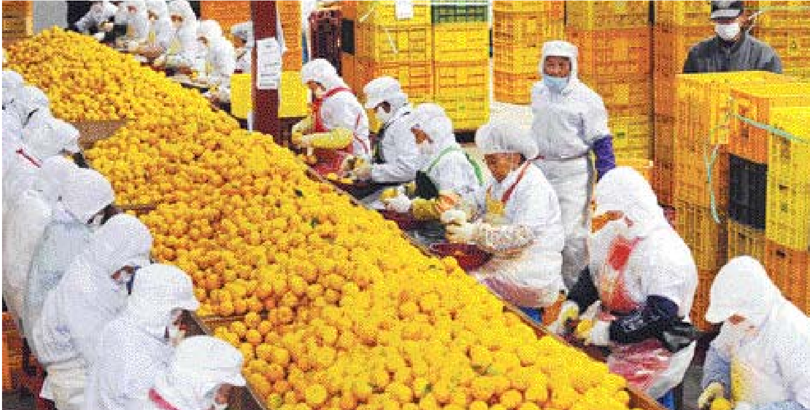
외국 가는 고흥 유자