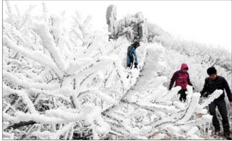
겨울철 안전산행을 위해선 아이젠·스틱, 비상식량, 여분의 휴대폰 배터리 등 안전장비를 철저히 갖추고 몸상태를 충분히 살펴 무리한 산행을 하지않는 자세가 필요하다.

울 산행시 주의해야 할 몇 가지 사항을 알아보면, 겨울철은 급격한 기온 변화로(해발100m 올라갈수록 0.6도씩 낮아지며, 초속 1m의 바람이 불면 체감온도는 2도씩 낮아진다) 인한 체온유지가 가능하도록 기능성 외투·털모자·장갑 등을 챙겨 보온을 유지할 수 있도록 하고, 경사지 등 빙판길 사고예방을 위한 아이젠·스틱 등 안전장비를 갖추며, 간단한 비상식량 및 여분의 휴대폰 배터리 준비와 함께, 조난사고 예방을 위해 최소 3인이상 동행하는 것이 필요하다, 또