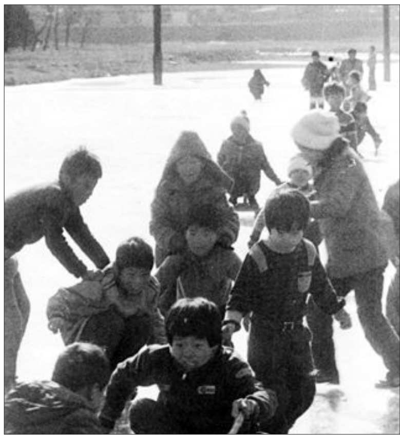
광주천 얼음 썰매타기 예전의 겨울은 지금보다 추웠던것 같다. 강이 얼기 일쑤였고 광주 도심을 가로지르는 광주천도 자주 얼어붙었다. 얼어붙은 강에는 아이들이 물러 얼음판 위에서 신나게 썰매를 타기도 했다. 1982년 겨울 광주천.