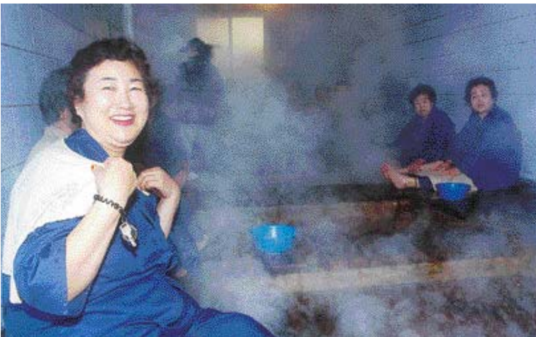
나비의 고장 함평에서 해수의 뜨거운물을 적서 마사지를 하는 해수탕을 체험할 수 있다.