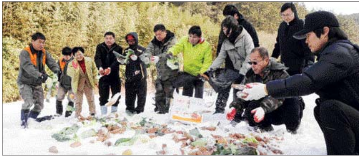
“야생동물들이 먹이 왔다” 한국야생동물보호관리협회 광주지부 회원 등 50여명이 12일 광주시 광산구 용진산에서 폭설과 한파로 먹이 구하기가 어려운 야생동물들을 위해 고구마와 배추, 사과 등을 던져주고 있다.