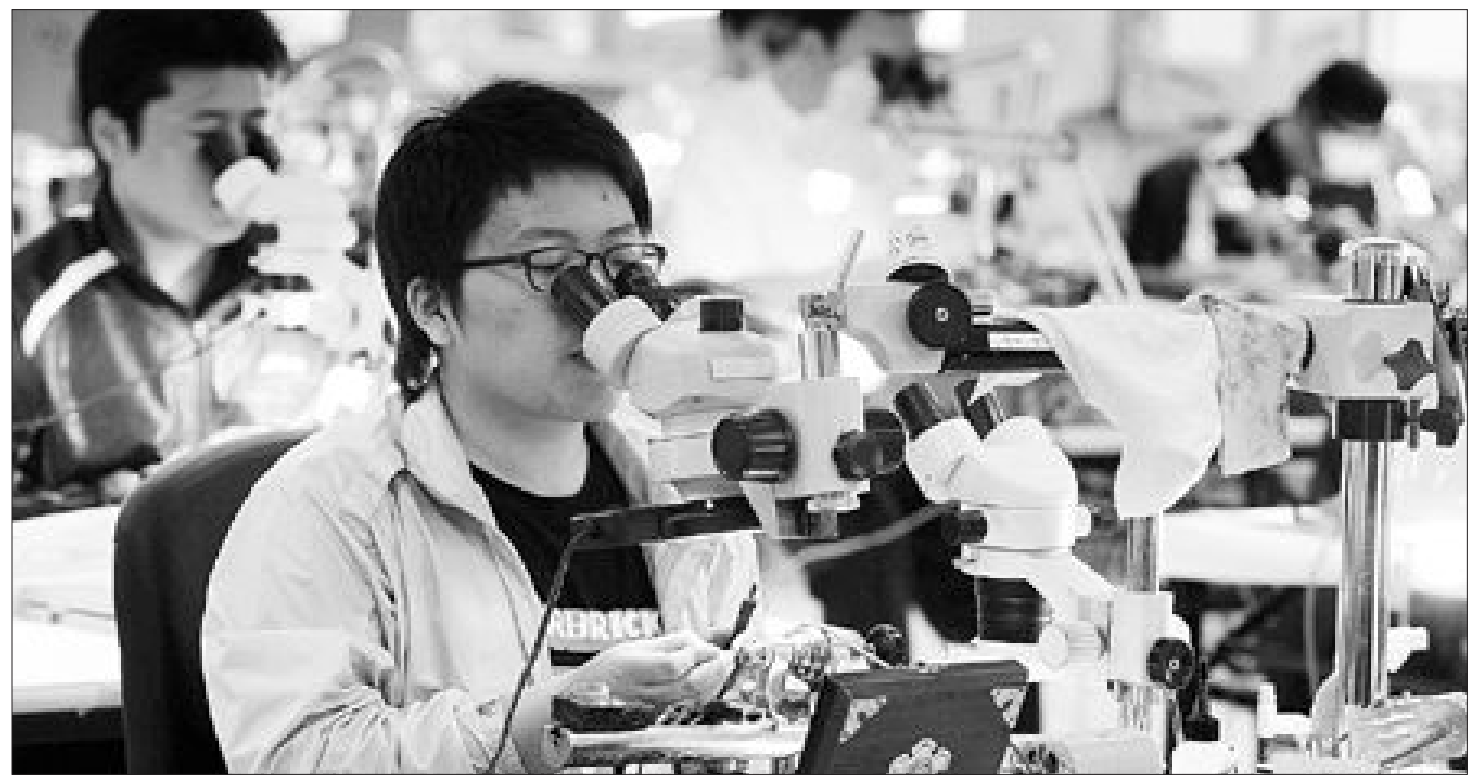
지난해 광주에서 열린 전국기능경기대회의 시계수리 종목에 참가한 광주공고 학생들이 현미경을 이용해 시계 내부를 들여다보고 있다.