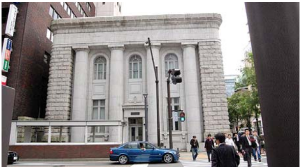
일본 요코하마의 구도심 내 옛 은행건물.