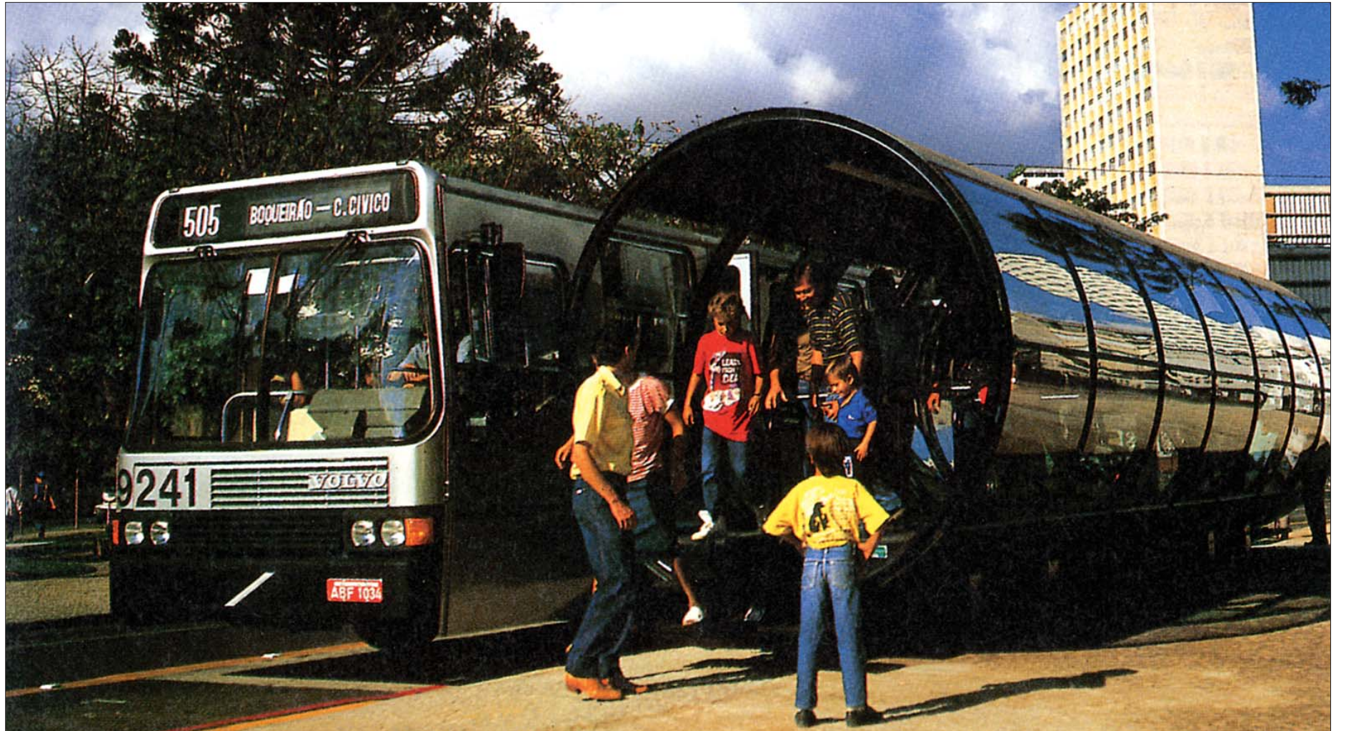
브라질 쿠리치바의 원통형 정류장. 버스를 통해 도시교통문제를 해결하면서 쿠리치바는 일약 '대안도시'로 세계 각 도시의 모델이 됐다. <박용남 저 '꿈의 도시 꾸리치바' 참조>

#아카렌가(赤レンガ, 붉은 벽돌)창고는 1905년 지은 부두 건축물로 그 용도를 다해 철거 위기에 있었다. 요코하마시는 시민들에게 친숙한 이 창고 2동을 귀중한 역사적 자산으로 보존하기 위해 1992년 민간소유자에게 매입한 뒤 '항구의 변화함과 문화를 창조하는 공간'으로 탈바꿈시켰다.