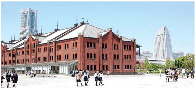
요코하마의 아카렌가 창고. 1905년 지어진 이 창고는 쓸모가 없어 철거될 처지였으나 시가 이를 매입해 문화·상업공간으로 탈바꿈시켰다.

광주일보의 각계 전문가의 조언, 창조도시 관련 서적 및 인체물, 그 외 정보 등을 통해 세계 곳곳의 창조도시 10곳을 선정했다. 이들 도시의 '창조의 현장'을 직접 찾아 창조적인 인재·시스템·도시 분위기·성과와 함께 등을 생생히 전할 예정이다.