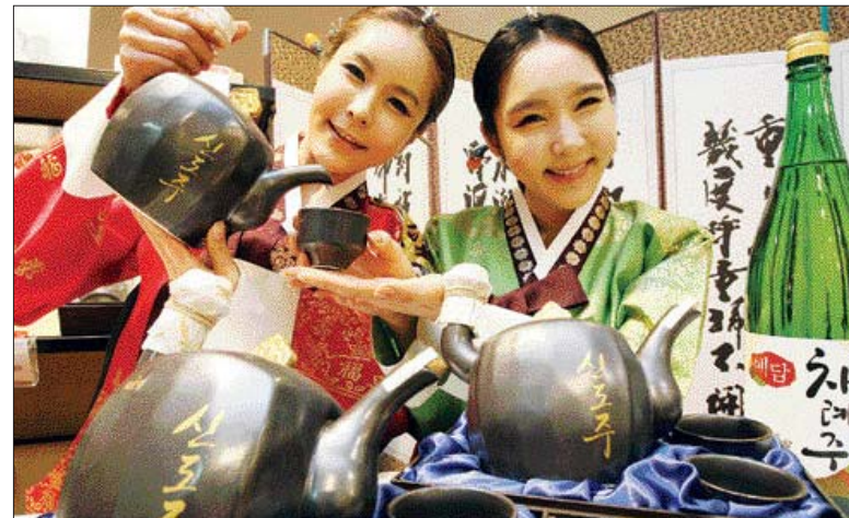
차례상에 올리세요 이 신도주를 선보이고 있다.

업종별로는 제조업이 1차금속 및 조립금속, 화학물·고무·플라스틱 등을 중심으로 100개가 늘어난 820개에 달했다. 건설업도 공공부분 발주 증가 등으로 전년보다 46개가 증가해 683개를 기록했고, 서비스업은 전년보다 211개가 늘어난 1천699개에 이르렀다. /윤영기자 penfoot@kwangju.co.kr