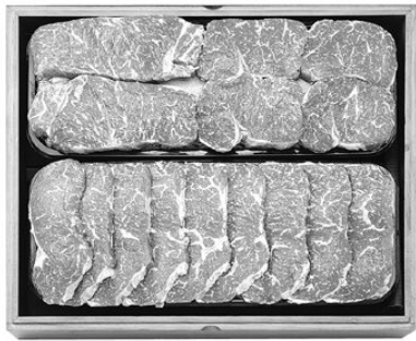
명품 목장 한우