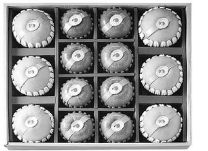
명품 사과 배 혼합세트