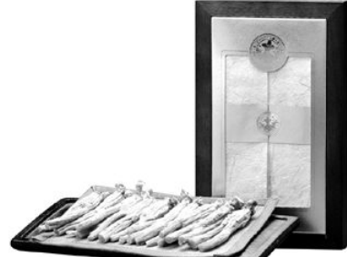
강개 상인 천삼

설이 일주일 앞으로 다가왔다. 경기가 회복 조짐을 보이고 있다고 하지만 주머니 사정이 넉넉지 않은 것은 올해도 마찬가지다. 여차피 사야 할 선물이라면 같은 값을 주더라도 좀 더 좋은 상품을, 쿠폰이나 할인행사를 눈여겨 봐뒀다가 선물을 사는 것도 알뜰하게 장만하는 요령이다.