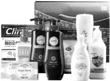
LG 명가명품 4호