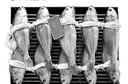
프리미엄 참 굴비