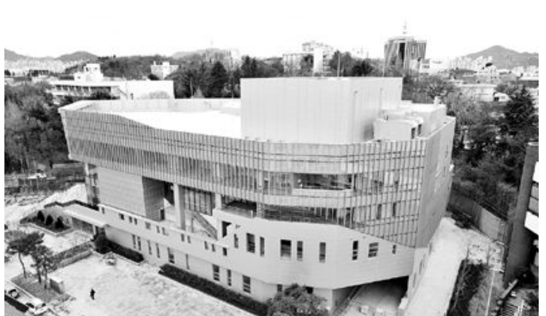
오는 22일 개관을 앞둔 빛고을시민문화관. 옛 구동체육관 자리에 들어선 이 문화관은 715석 규모의 전문 공연장 시설을 갖추고 있다.

한편 271억 원의 법적 의무경비를 확보하지 못했고, ▲북구 228억 원 ▲남구 185억 원 ▲동구 136억 원 ▲서구가 70억 원 등을 확보하지 못한 것으로 나타났다.