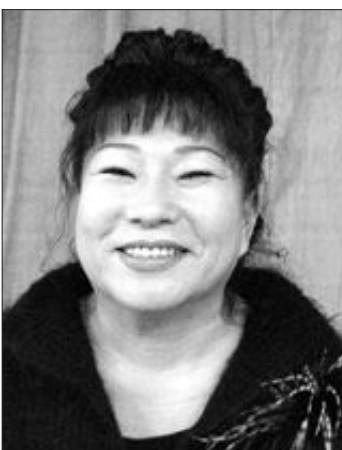
하는 등 당시 얻은 경험이 한복 교육에서도 큰 도움이 됐다. 교육을 받는 이주여성들의 열정도 커서 한복 교육이 끝난 후 ‘아기옷 만들기’ ‘벨트 제작하기’ 등 강의를 이어갈

오 강사는 한복 교육뿐 아니라 자신이 운영하는 야화에서도 이주여성들에게 2년여간 한글 교육을 한 적이 있다. 이때 그들과 온몸으로 대화를 하고 가치관에 대해 이야기