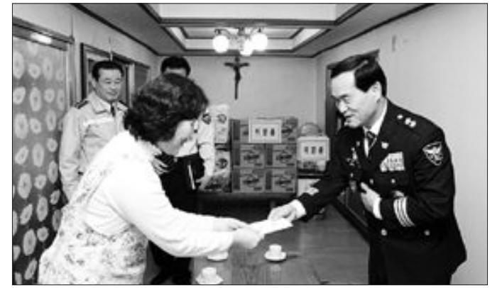
박용규 전남지방경찰청장(오른쪽)은 설 명절을 맞아 최근 장성군 남면 평산리 '사랑의 종의 집'을 방문해 위문품을 전달했다.