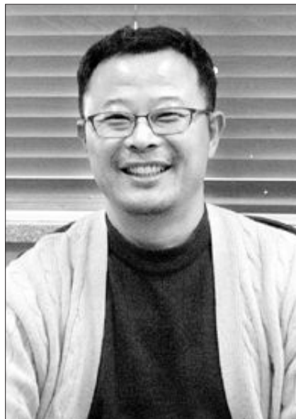
육이나, 생활원에·애완동물·웹디자인·전자상거래 등 직업교육도 자신이 원하는 과목을 선택해 들을 수 있다. 한 교장은 “아이들의 자존감 회복이 중

돈보스코 학교에 들어오는 학생들은 학교와 사회, 부모에게서 외면의 눈길을 받았던 만큼 마음의 상처를 치유하는데 힘을 쏟을 예정이다. 전문 교육을 받은 신부와 수사들도 교사로 참여해 다양한 청소년 활동에 매진했던 경험을 이곳에서 풀어내게 된다. 학생들은 연극이나 애니메이션·사진·그룹사운드·당구·골프 등 특기적성 교