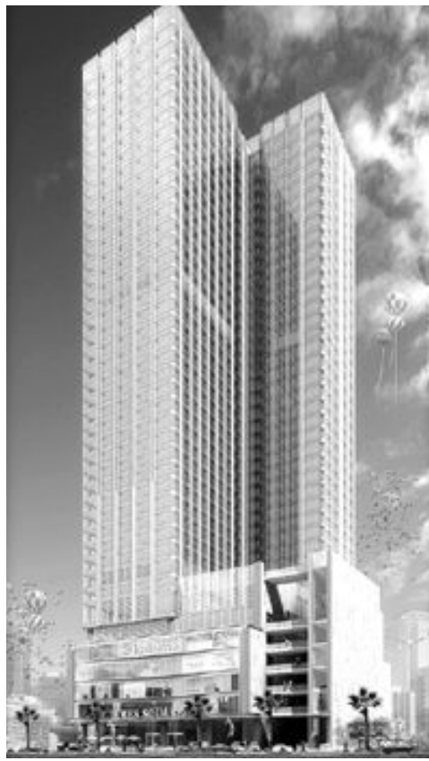
금호건설이 베트남 타임스퀘어사로부터 수주한 호치민시 주상복합 아파트 조감도.

할 계획"이라며 "경영정상화 계획 약정 이전 시공간에 이같은 대형 수주 실적을 거둔 것은 이례적인 일로 회사의 잠재력을 입증해주는 사례다"고 밝혔다. 금호건설은 지난해 말 워크아웃 신청 이후 지금까지 성남여수아파트 4공구, 경부고속도로 동김천나들목 건설, 금강·낙동강살리기 등 1천400억원의 수주실적을 올렸다. 이번 베트남 주상복합아파트까지 포함하면 한 달 사이 총 2천600억원의 수주실적을 올린 셈이다. 금호건설은 이번 수주로 워크아웃 결정 이후 주춤했던 해외 수주 활동에 본격적으로 시동을 걸어 국내 시장에서 부정적 이미지를 벗고 경영정상화에 전력을 다한다는 방침이다. 올해 전체 신규수주 목표는 3조7천억원으로 이중 27%에 해당하는 1조원을 해외에서 올린다는 계획이다.