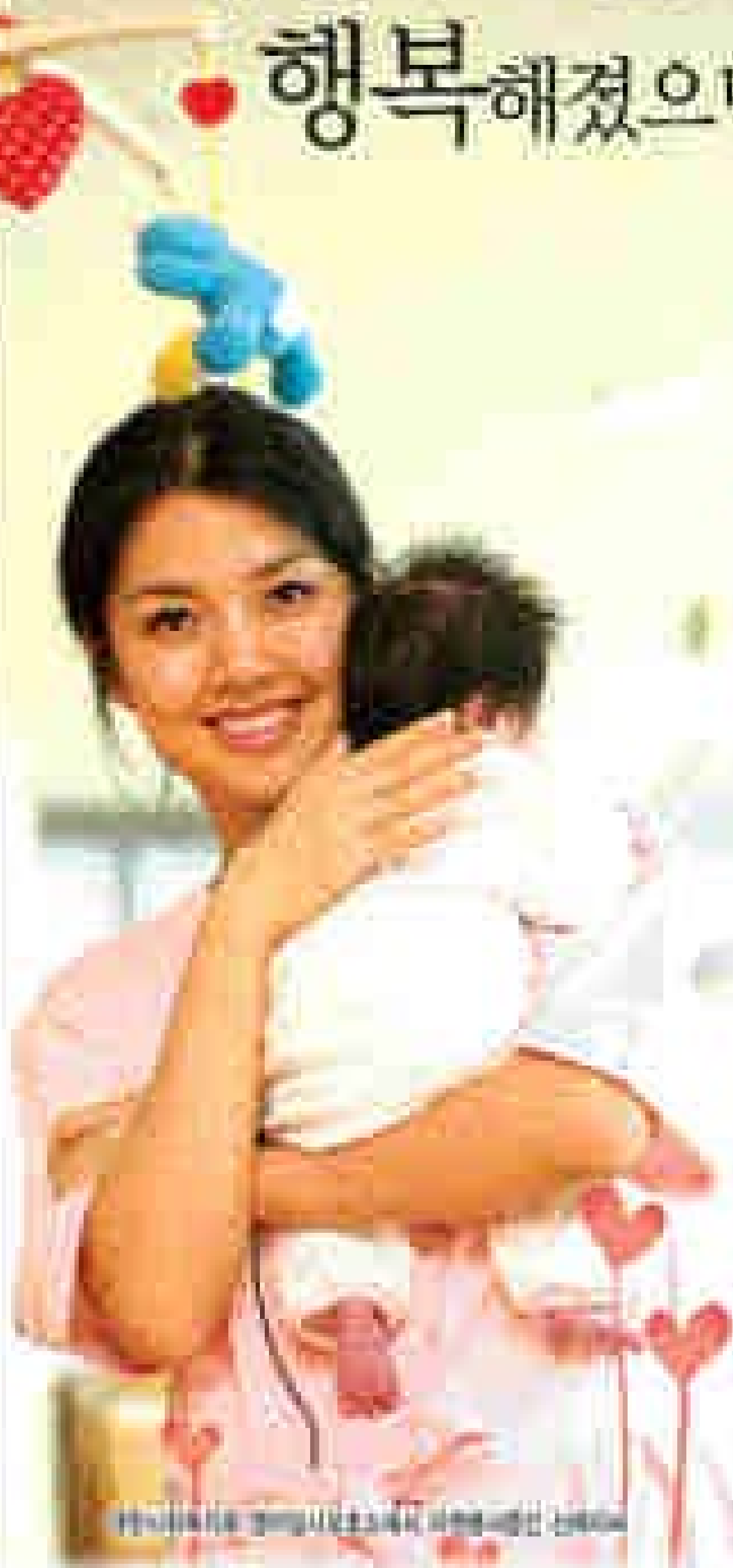
광주영아입시보호소, 영아입시보호소에서 영아를 입양한 신부님

자세한 내용은 전화 또는 www.gwangju.go.kr 192-200-3300