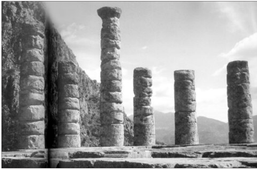
그리스 중부 델포이에 위치한 아폴론 신전은 고대 세계에서 신력을 행하던 신전으로 가장 유명했다.

세계 7대 불가사의 중 하나를 꼽히는 에페소스의 아르테미스 신전으로 떠나보자. 지금의 터기 서해안에 있던 고대 도시 에페소스에 자리잡은 이 신전은 그리스를 뛰어넘는 고대 문명의 보고로 알려산터 대