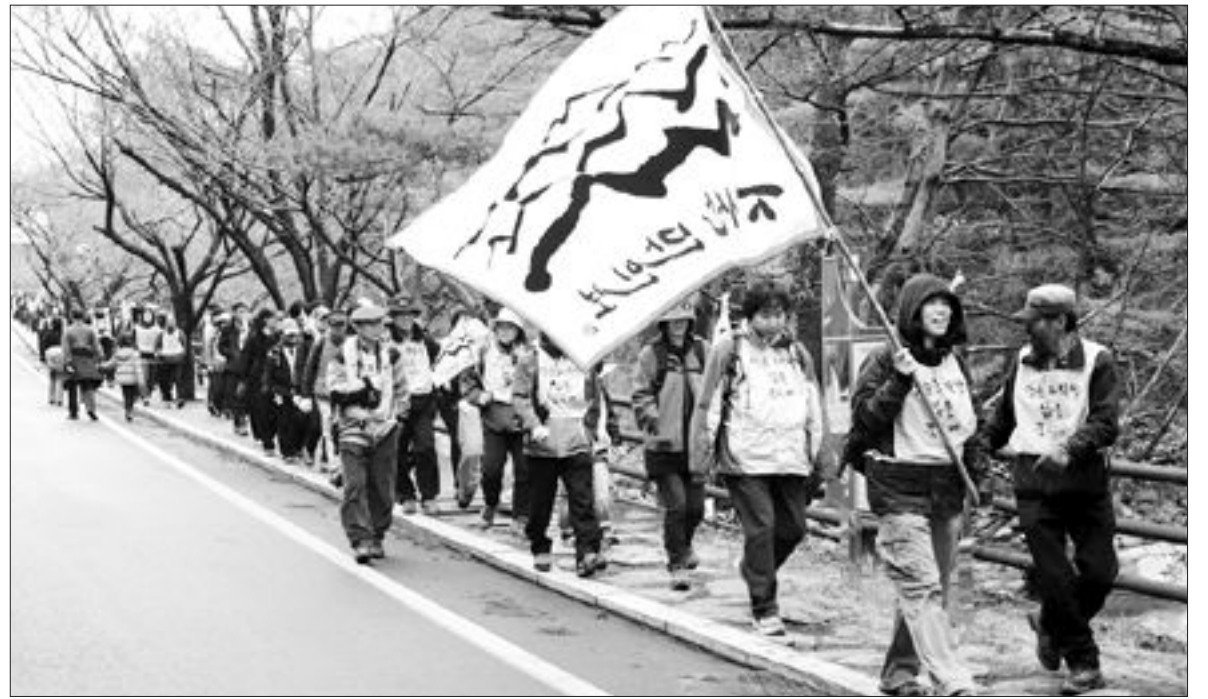
지리산 둘레길 萬人步 출발

지리산 둘레 850리 길을 걸으며 자연과 생명, 역사를 체험하는 '지리산 만인보(智異山 萬人步)' 참여자들이 지난해 28일 구례군 함천면 남악사를 출발해 힘차게 걷고 있다. '지리산 만인보'는 내년 2월까지 지리산 남, 경남, 산청, 함안·하동 등 지리산 둘레길 곳곳을 구간별로 나눠 매달 둘째·넷째 주 토요일에 24회에 걸쳐 진행된다.