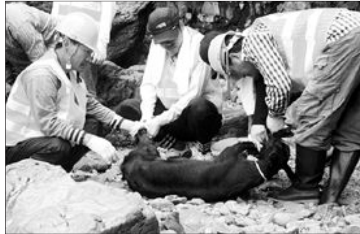
훼손지역에 상록할엽수를 식재할 예정이다.

올해에는 사업비 3억원을 들여 23개 도서지역에서 방목가축 243마리를 잡아내고, 1천200여㎡의